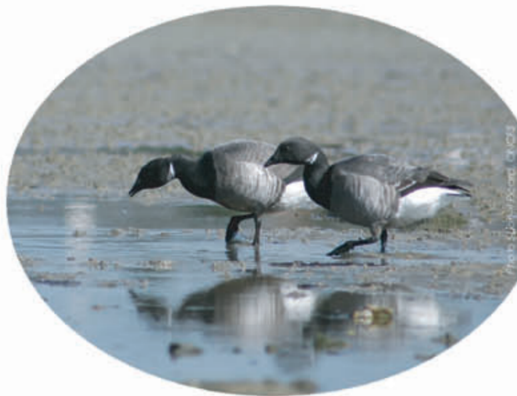
La Barnache cravant, petite oie de teinte gris sombre, se nourrit essentiellement de zostères. Rare au niveau mondial (population estimée à 200 000), elle est abondante dans le golfe avec près 15 000 individus au mois de novembre.

Les premiers migrateurs et hivernants arrivent dès le mois de juillet, le pic d'abondance atteint plus de 60 000 oiseaux courant novembre et décembre. La plupart se dispersent sur les vasières et les herbiers pour s'y alimenter à bassemer, et se regroupent dans quelques anses abritées pour se reposer à marée haute. Dans certains secteurs comme l'anse de Tascon, la baie de Sarzeau, les marais de Séné, il est possible d'observer simultanément plusieurs dizaines d'espèces : canards, limicoles, hérons et aigrettes, laridés . De plus petits groupes fréquentent l'ensemble du golfe, notamment les espèces plongieuses (harles, garrots et grèbes), plus discrètes et en pleine eau.