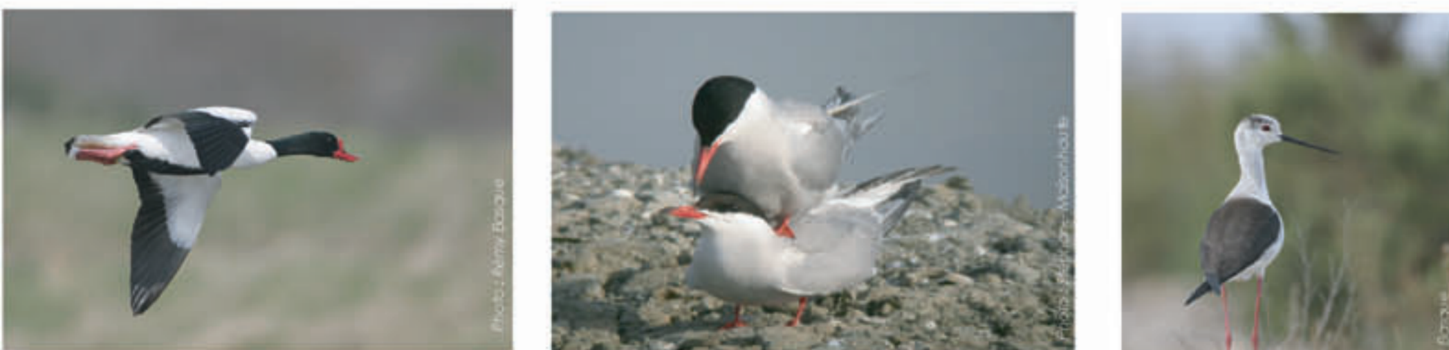
Trois espèces nicheuses dans le golfe (de gauche à droite) : le tadorne de Belon, observable toute l'année, la sterne pierregarin et l'échasse blanche, présentes seulement au printemps et en été.

Au printemps et en été, diverses espèces nichent dans le golfe . Sternes pierregarins, avocettes élégantes et échasses blanches nichent en colonies dans les marais endigués (Séné, Le Duer, Pen en Toul, Lasné). D'autres espèces nichent principalement sur les îlots du golfe , à la cime des arbres comme les aigrettes garzettes ou les grands cormorans, sous les fourrés comme les tadornes ou au sol comme les sternes et les goélands. Les oiseaux sont particulièrement sensibles au dérangement en période de nidification, soit généralement du mois d'avril à mi-juillet.